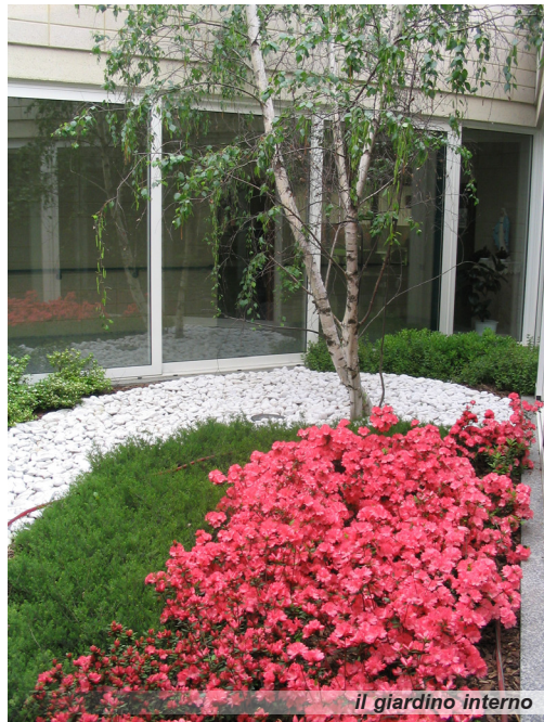
il giardino interno

Questi valori, enucleati nel Codice Etico della cooperativa, condivisi con i soci e i lavoratori, informano il comportamento e l’azione dei suoi componenti a tutti i livelli di responsabilità.