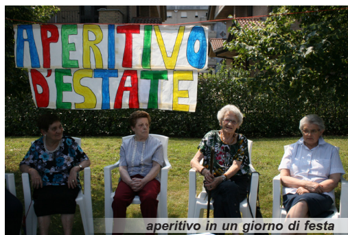
aperitivo in un giorno di festa